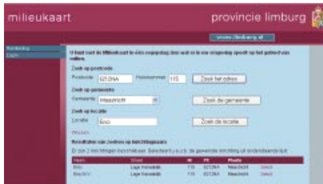
Lokatiezoeker Milieukaart. (zie ook: www.limburg.nl/milieukaart/ )

De Milieukaart is in een zeer kort tijdsbestek tot stand gekomen. Dit noodzaakte tot een intensieve samenwerking tussen de betrokken afdelingen: Geo-informatie en Vastgoed, Informatie en Automatisering, Handhaving & Monitoring en Vergunningen, hetgeen goed is gelukt. Het ontwikkeltraject met open source software was een leertraject. Het blijkt echter wel dat als gekozen wordt voor bewezen software en ervaren partners, het risico beheersbaar is. Daarbij komt nog het voordeel dat de gebruikte ontwikkelingswijze redelijk snel en flexibel is. Uiteindelijk is de klant tevreden met een professioneel ogende Milieukaart die een faciliterende rol kan vervullen naar partners. De informatiedeskundigen zijn een stap verder met het realiseren van een efficiënte, open en 'state of the art' geo-infrastructuur.