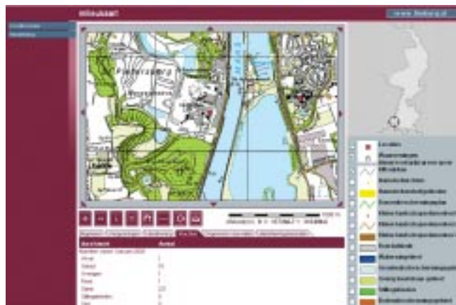
Interface Milieukaart. (zie ook: www.limburg.nl/milieukaart/ )